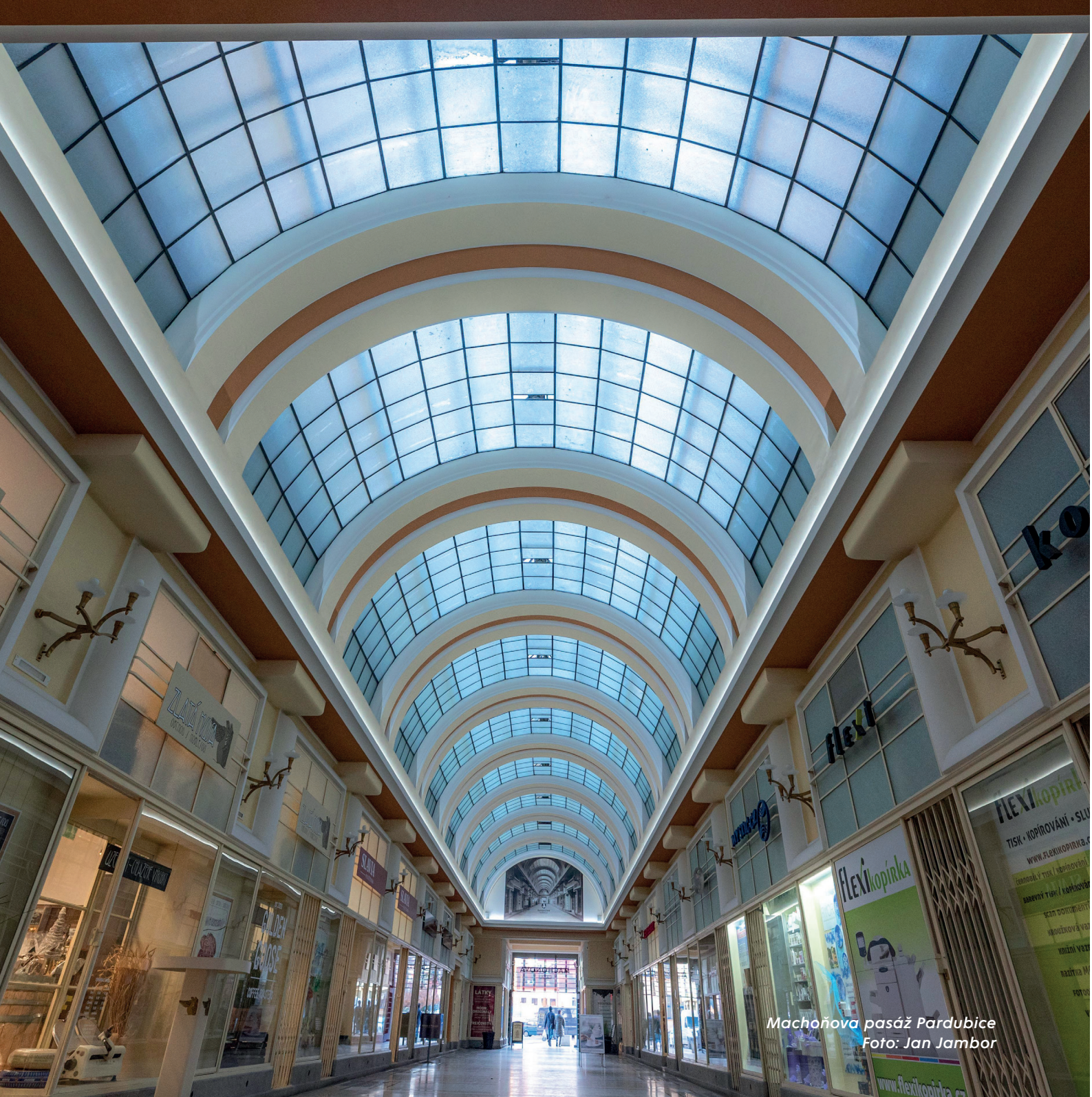
Machoňova pasáž Pardubice