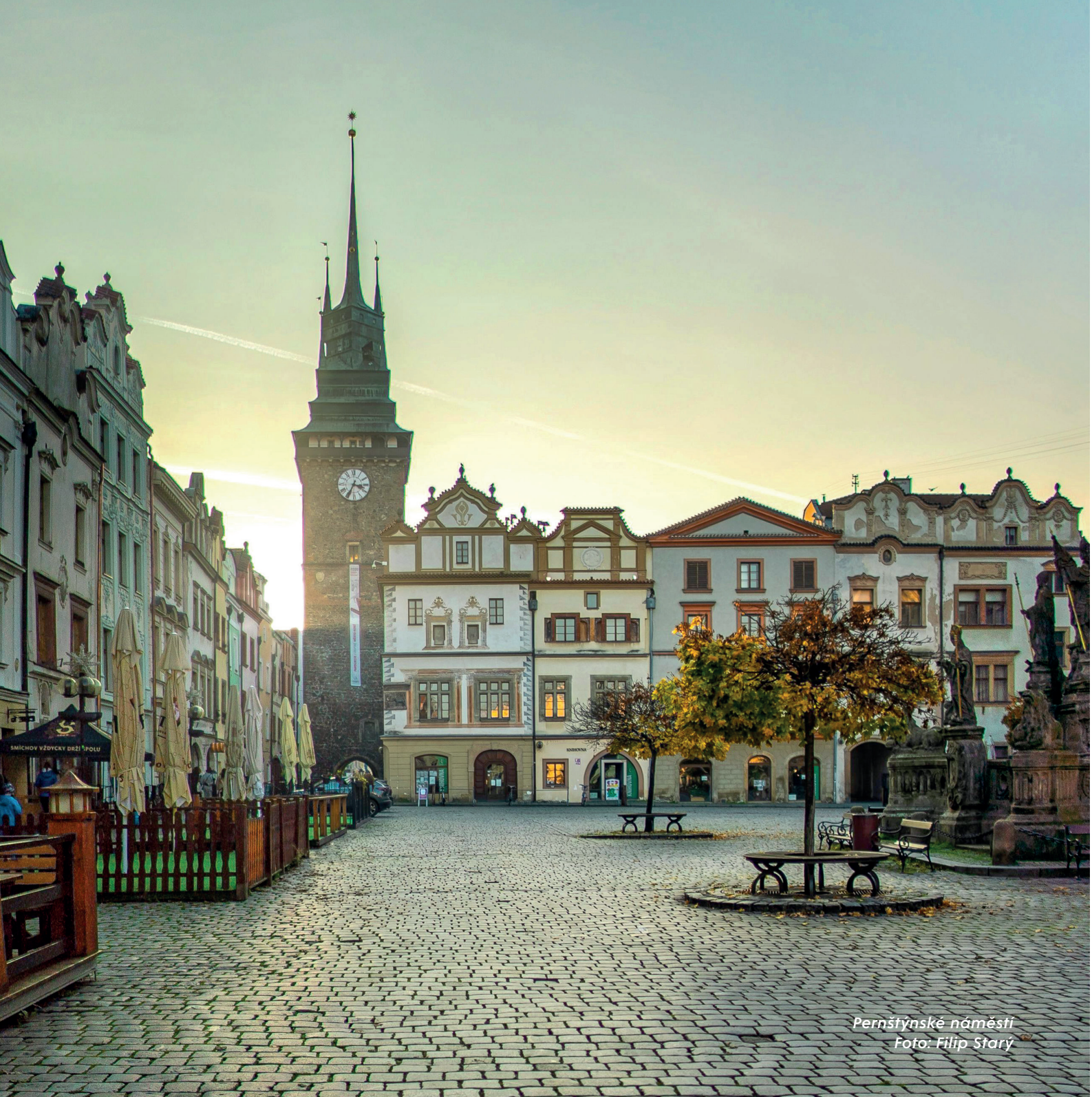
Pernštýnské náměstí