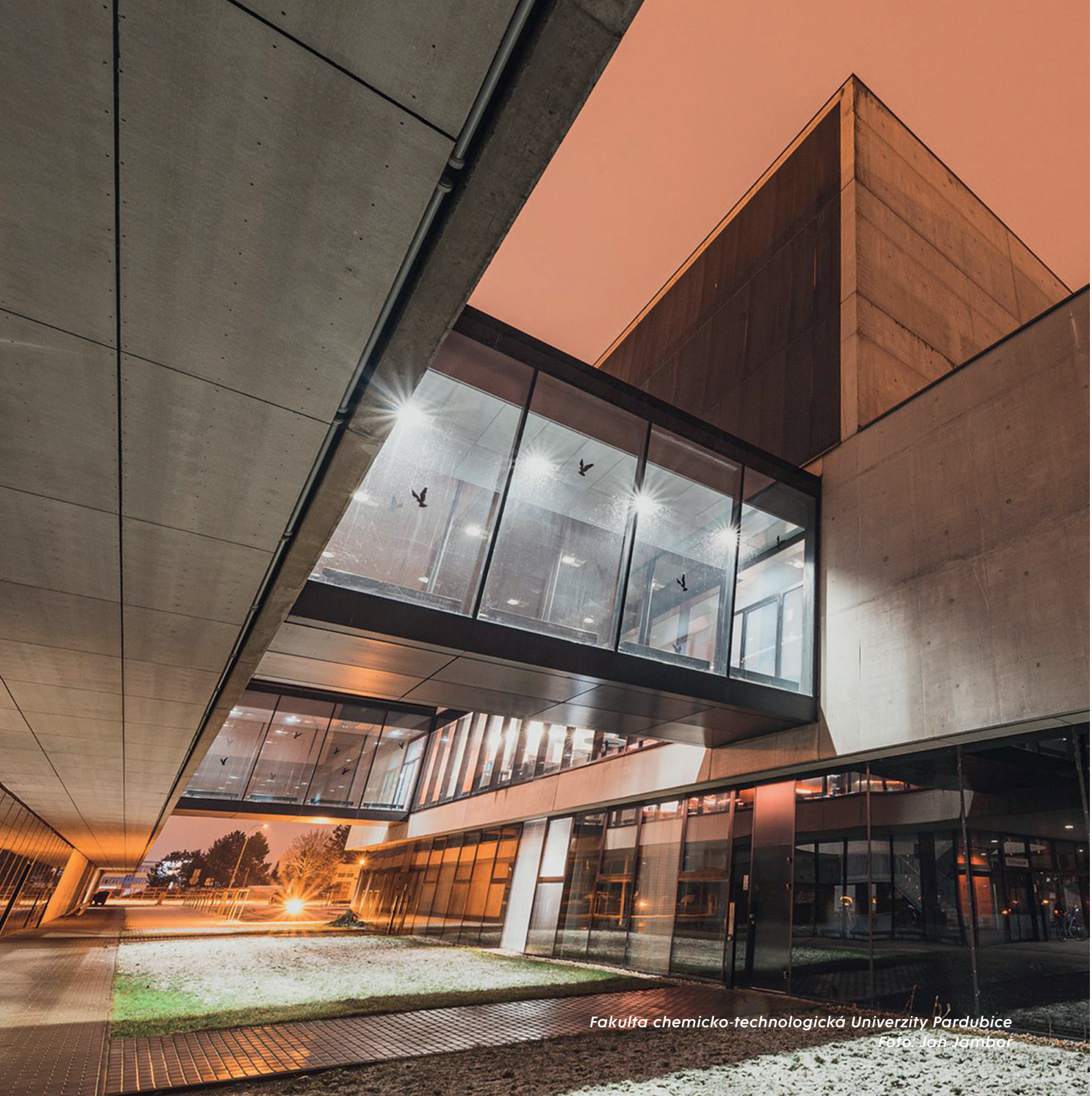
Fakulta chemicko-technologická Univerzity Pardubice