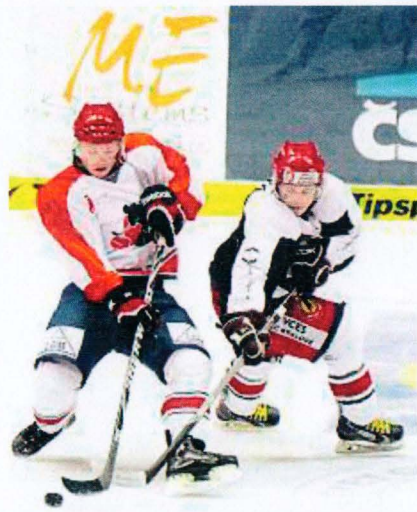
Studenti Univerzity Pardubice budou chtít získat první výhru v derby.

I třetí ročník by tak měl divákům přinést atraktivní podívanou. Tým pardubických hokejistů se bude snažit, co jen to půjde, aby zabránil týmu z Hradce Králové získat hat-