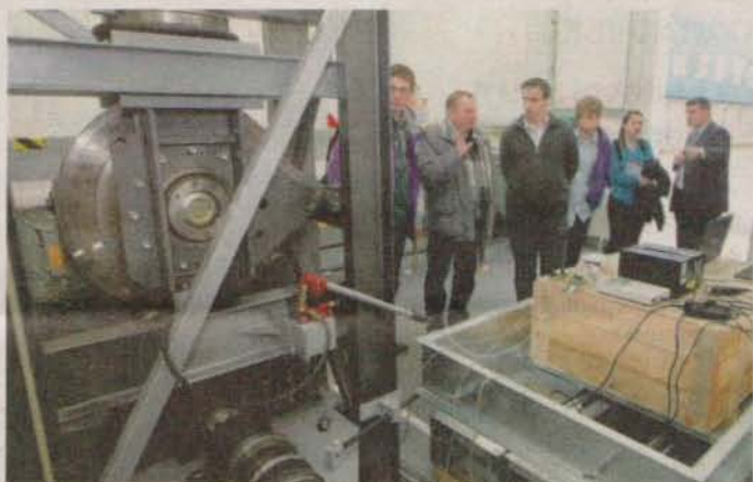
DOPRAVNÍ FAKULTA Jana Pernera Univerzity Pardubice slaví dvacáté výročí své existence.

Zapojují se do projektů základního i aplikovaného výzkumu, a to jak na poli domácím, tak v rámci mezinárodní spolupráce. Zajišťují i další celoživotní vzdělávání a univerzitu třetího věku. (mm)