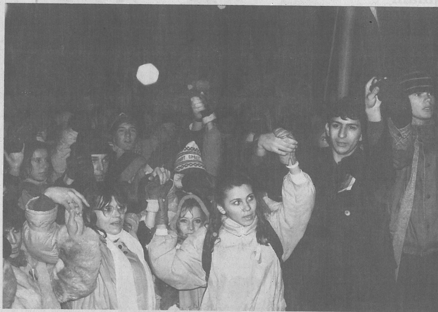
POSPOLITOST, OHLEDUPLNOST A KLID. Tři znaky, které provázely takzvanou sametovou revoluci také v Pardubicích.