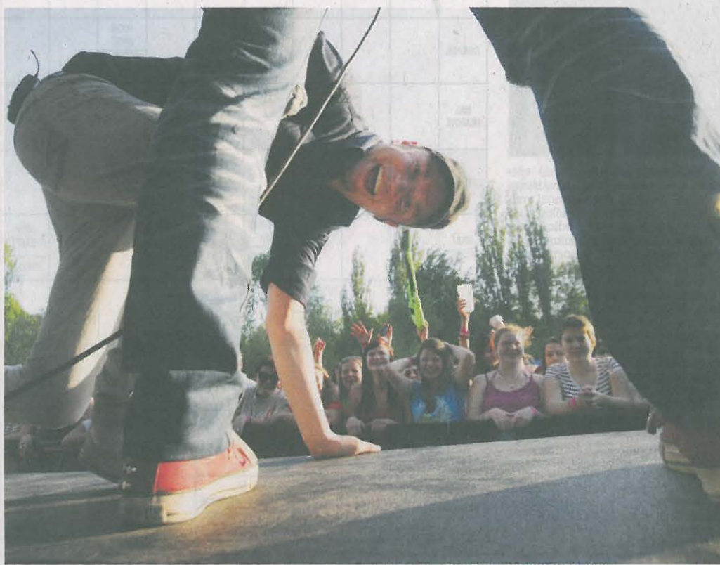
KAPELA UDG to na Majálesu v Pardubicích pořádně rozjela. Zahrála i nové písničky.

A od té chvíle už nemělo publikum šanci se zastavit. Na programu totiž byla další domácí kapela Volant. A jestli se na Duklu Vozovnu strhla mela, tak na Volanty to bylo peklo. Kapela proto nemohla zapomenout na pecky jako Pa-