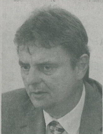
Miroslav Ludwig, rektor Univerzity Pardubice

Obecně si myslím, že každé ocenění tohoto typu má smysl, protože jde o ocenění zvnějšku podle určitých kritérií. Nejde o to, že bychom se hodnotili sami. Záleží pak už jen na tom, jak se to kraji podaří využít.