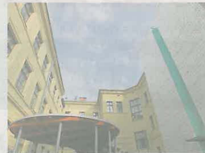
Altán nejen pro studenty Ve dvoře historické budovy vyrostl altán, který umožní venku pořádát nejrůznější akce.

Sklobili historii se současností Rekonstrukce historické části univerzitního objektu se uskutečnila na ploše sedmi tisíc metrů čtverečných a týkala se více než 190 místností včetně dvorního traktu.