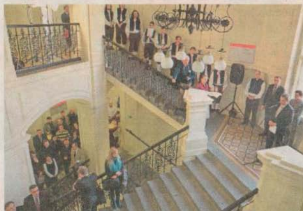
Pardubická univerzita slavnostně otevřela nové IT centrum. Sloužit bude hlavně badatelům a doktorandům.

V některých částech se dokonce dochovala původní dlažba. V místech, kde ji nebylo možné restaurovat, jsou odpovídající repliky.