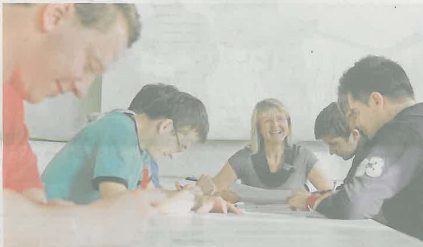
Začínáme! Stavbařii dokončili modernizaci historické budovy univerzity už vloni na podzim, ale pak několik měsíců trvalo nastěhování. Včera se už v moderních učebnách studenti učili.

Univerzita Pardubice získala historický objekt bývalé Státní průmyslové školy v roce 1951. V 60. letech k ní byla přistavěna další část. V 90. letech už objekty potřebám školy, která má dnes sedm fakult, nestačily a v Polabínách vznikl ucelený univerzitní kampus.